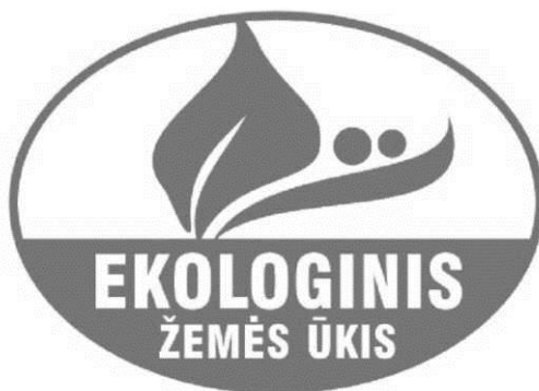
1 pav. Spalvotas ekologiškų produktų ženklas

9. Spalvotas ekologiškų produktų ženklas (žr. 1 pav.):